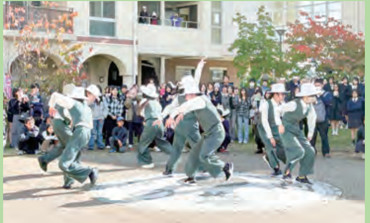
ヴォーリスデーでの高校のダンス