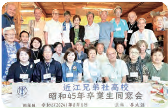
近江兄弟社高校 昭和45年卒業生同窓会

恩師の先生方は、ほとんど逝去されています。亡くなった学友も。学友の一人が、高校時代を振り返り、当時の