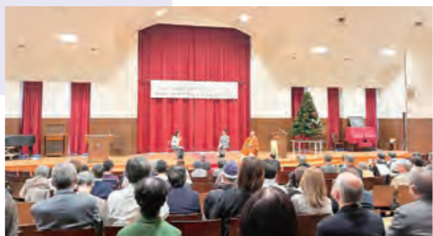
12月7日 総括講演「愛と平和に満ちた共に生きる社会をめざして」