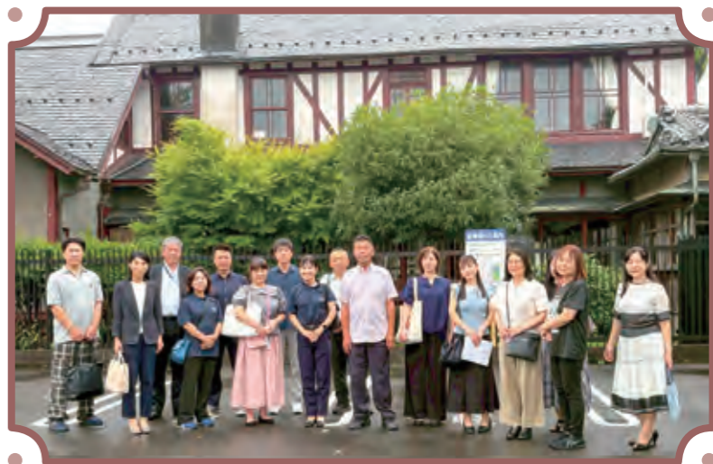
旧伊庭家住宅を見学