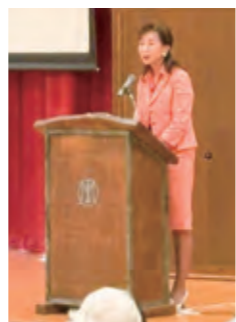
第5回講演 玉岡かおる氏