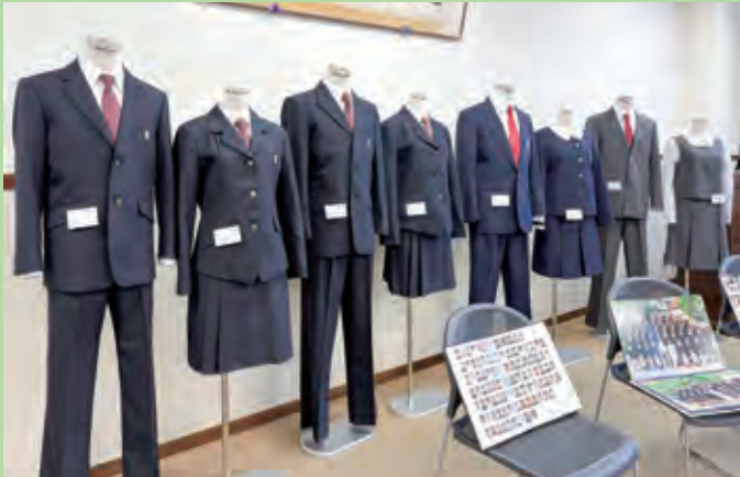
同窓会コーナーでの歴代制服の展示