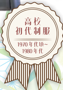
当時では珍しいグレーの学生服 中学とはエンブレムの色で 区別していた